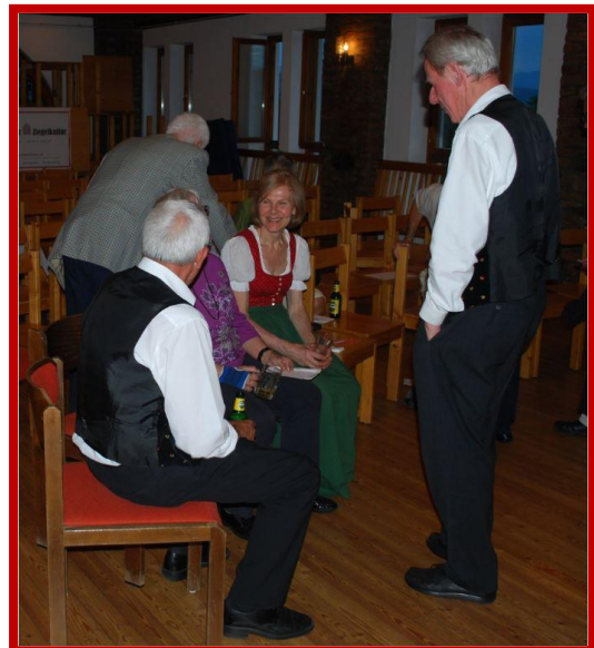
...eine kleine Pause für die Musik, denn...