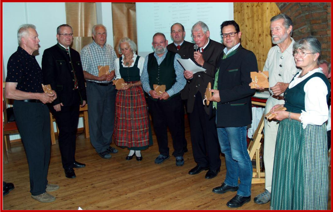
Mitglieder mit dem Ehrengeschenk für 10 jährige Mitgliedschaft