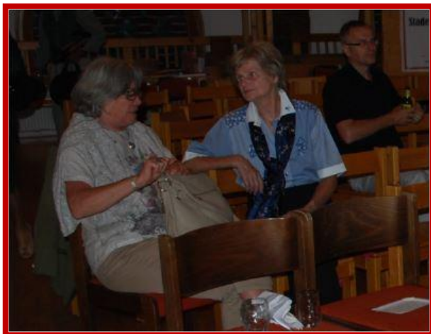
Small Talk unter den Mitgliedern und ....