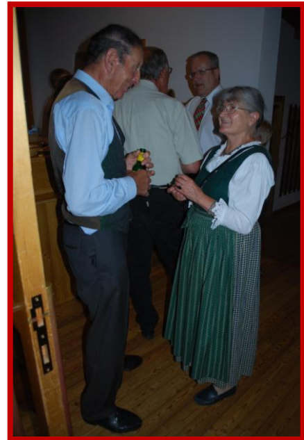
Frau Leute im Gespräch