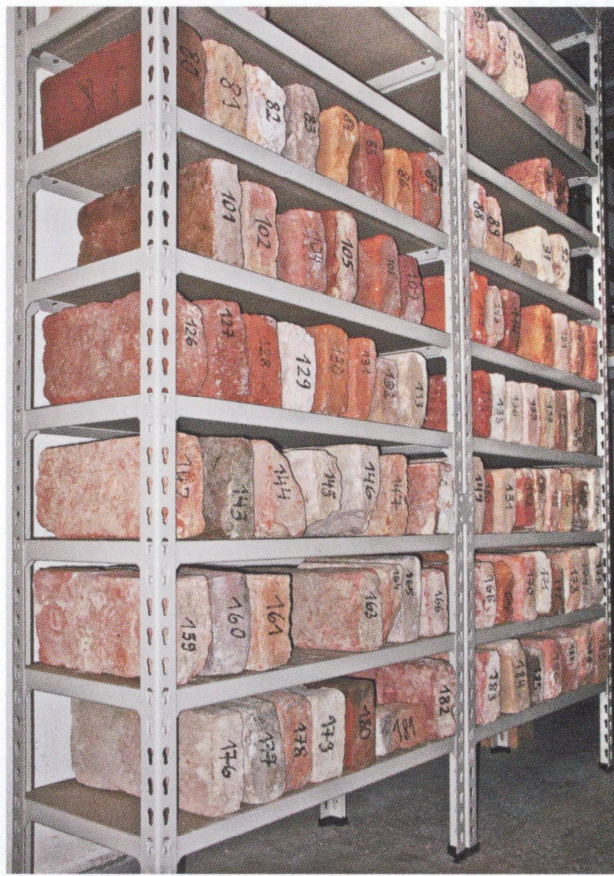
Abb. 56: Einblick in die Studiensammlung historischer Ziegel im Landwirtschaftsmuseum Ehrental in Klagenfurt

Abb. 57: Ein nicht mehr existentes Industriedenkmal Kärntens, der 2011 abgerissene Ringofen der Ziegelei Wandelnig in Eberdorf bei Althofen